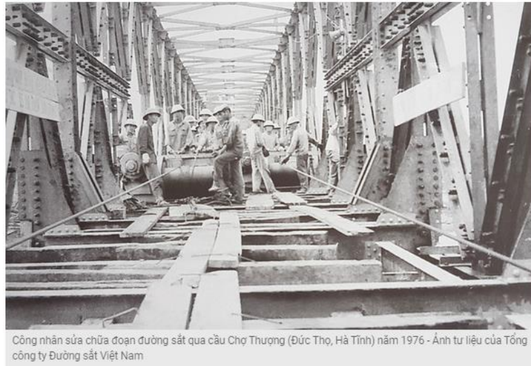
Công nhân sửa chữa đoạn đường sắt qua cầu Chợ Thượng (Đức Thọ, Hà Tĩnh) năm 1976